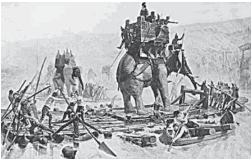
Representação da marcha de Aníbal até a Itália, ocorrida durante a Primeira Guerra Púnica.

O conflito foi violento, cheio de altos e baixos para ambos os lados. Dentre os seus momentos mais espetaculares, destacaríamos a campanha cartaginesa, liderada por Aníbal que, partindo da Espanha e atravessando os Pireneus com um grandioso exército, atacou os romanos pelo norte. Embora, nessa travessia épica, Aníbal tivesse perdido quase metade de seus homens, esse foi um dos momentos mais ameaçadores vividos por Roma durante a guerra. Os romanos chegaram muito perto da derrota, porém conseguiram se reorganizar e derrotar os cartagineses, conquistando seus domínios e destruindo completamente Cartago em 146 a.C.