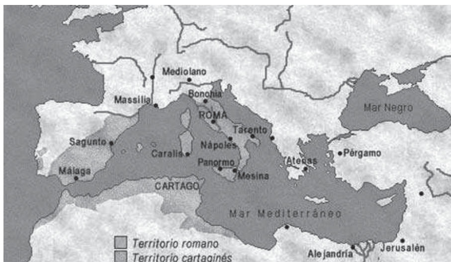
Mapa com a localização de Cartago, no norte da África.

Após terem submetido os povos da Península Itálica aos seus domínios, os romanos voltaram suas atenções aos cartagineses, um povo fenício que controlava a navegação no Mediterrâneo Ocidental.