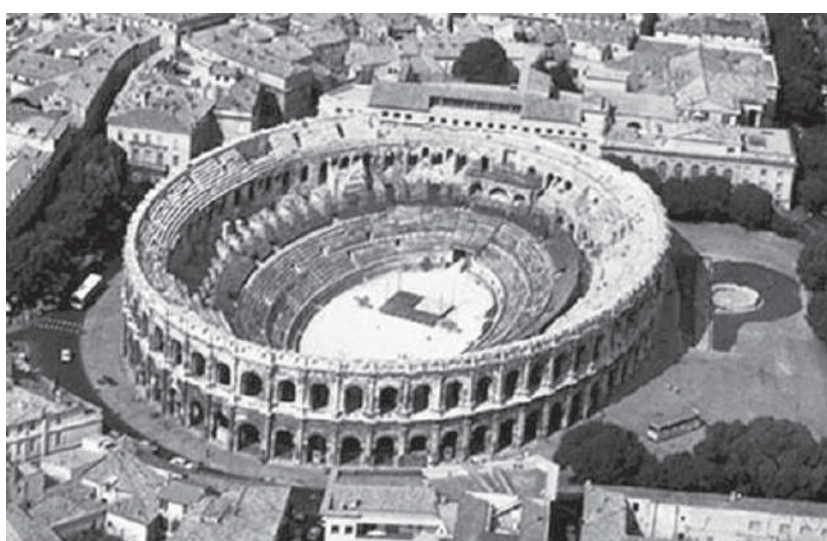
Fotografia do Anfiteatro de Nîmes. Autoria não-identificada. Nîmes é uma cidade do sul da França, fundada pelos romanos, como colônia. A Arena foi construída no final do Séc. I d.C. O anfiteatro de Nîmes é um dos maiores da Gália Romana. Tem capacidade para 20.000 espectadores que, no passado, assistiam lutas de animais e gladiadores.

Caro aluno ou cara aluna, nesta aula iniciaremos nossos estudos sobre o Império Romano. É claro que pelo espaço que teremos para abordar o assunto vamos apresentá-lo apenas em suas linhas gerais. O aprofundamento do tema dependerá de seu interesse em buscar informações em outras fontes além deste manual. Lembre-se de que o universo de pesquisa no campo da História Antiga é quase infinito, assim como em outros campos de estudo. Dessa forma, você, na condição de futuro(a) professor(a) de História, não se deve contentar com o mínimo. Busque sempre mais informações, pesquisando no máximo de fontes que você dispuser.