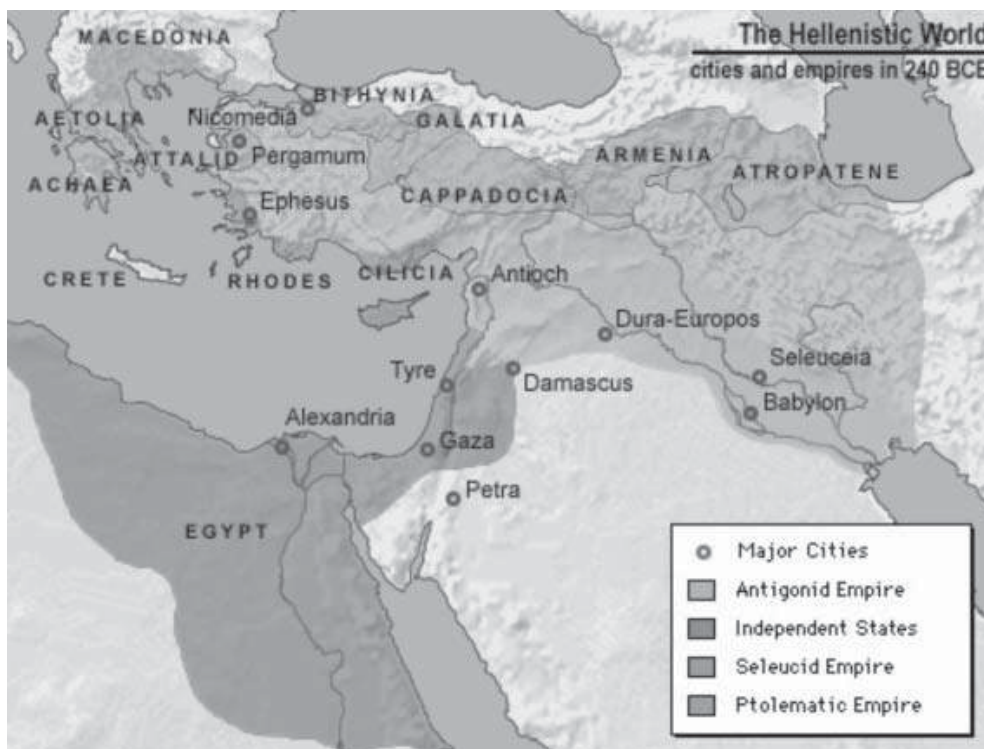
Mapa representando o mundo helenístico.

Após o término da segunda Guerra Púnica (202), quando o poderio cartaginês foi praticamente destruído, Roma passou a atacar o reino helenístico da Macedônia, e seus aliados, em resposta ao apoio dado a Cartago. Com habilidade política e estratégia militar, conseguiram vencer seus inimigos e impor seu domínio. Em 188 a.C., com a submissão dos reinos helenísticos e das cidades gregas que lhes ofereciam resistência, Roma torna-se também senhora do Mediterrâneo Oriental.